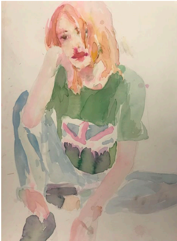
„Sophie“, 2021 Tusche auf Papier, 74 x 47 cm, gerahmt