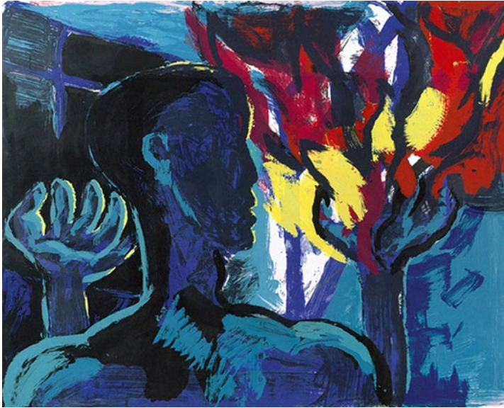
Die brennende Mauer, 1986 Farbserigraphie auf Felix, 100 x 124,2 cm, Edition 1/50, signiert und datiert