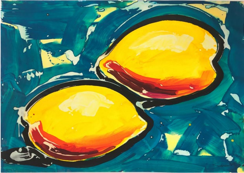
Zwei Zitronen, 2018 Tempera auf Papier, 160 x 120 cm, gerahmt