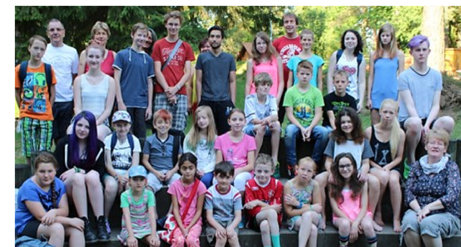
K.i.s.E.–Kids und Geschwister auf der Ferienfreizeit. Oft sind die Kids zum ersten Mal ohne ihre Eltern unterwegs. Ein positives Erlebnis das unvergessen bleibt und unabhängig macht!